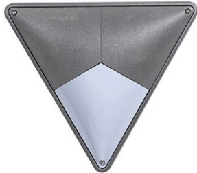
WL-D HARTMUT X/1 LED