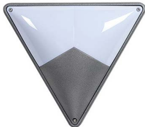
WL-D HARTMUT X/2 LED