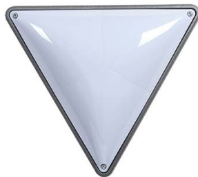
WL-D HARTMUT X/3 LED